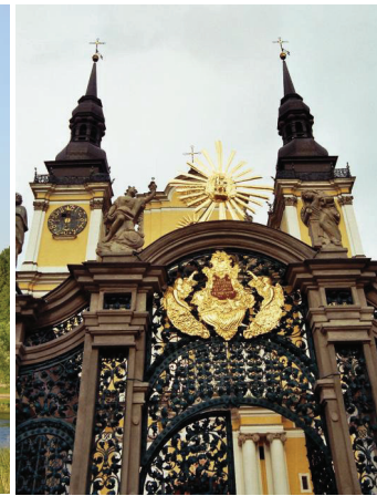
Barockkirche von Heiligelinde