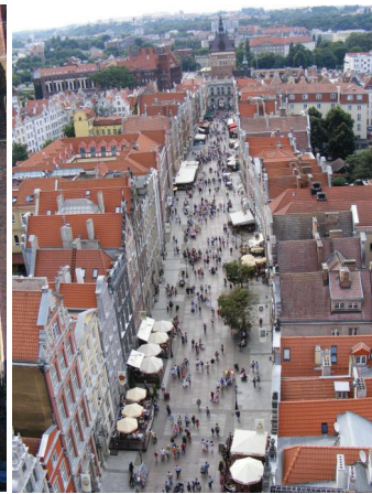
Lange Gasse, Danzig