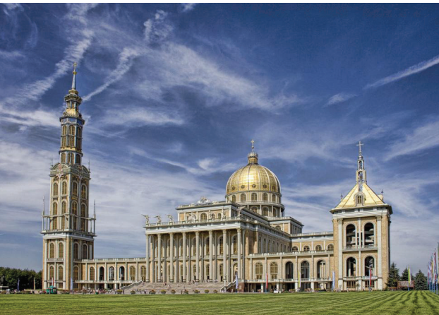
Basilika von Lichen