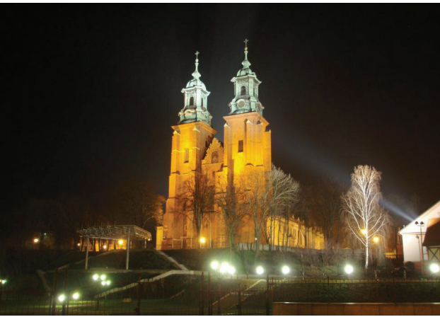
Dom von Gnesen