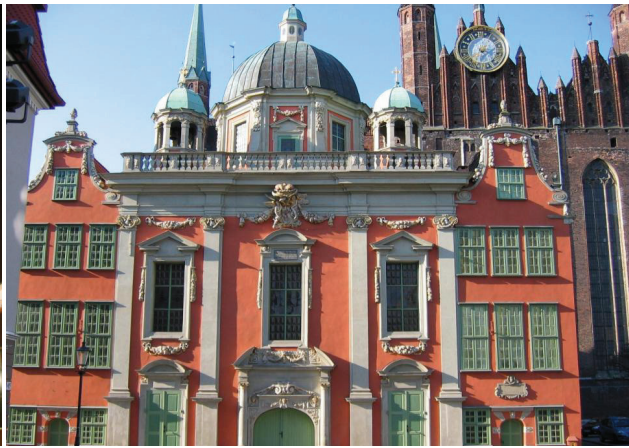
Königliche Kapelle von Danzig